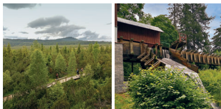
Jezerní slat' – rašeliniště Vodní elektrárna