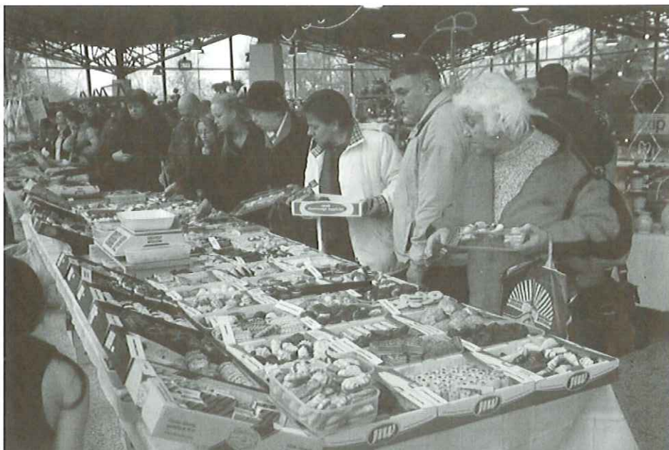
(Fotografie byly pořízeny na minulém ročníku Vánoční Frory 2008)

Brány Výstaviště Flora Olomouc budou otevřeny denně od 9 do 18 hodin, poslední den trhů do 17 hodin.