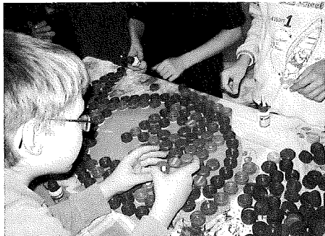
(vyrábíme rybu z víček od PET láhví)

Z umělohmotných cívek od nití jsou zase krásné svícny, z hliníkových obalů od čajových svíček vánoční ozdoby, z papírových ruliček od toaletního papíru kmeny stromků nebo tělíčka andělů, z plastových vršků od PET lahví různé mozaiky, z krabic třeba „perníkovic“ betlémy a spoustu jiných krásných a zajímavých věcí. A pak, že odpadky patří do koše! Rozhodně ne všechny, protože.....ale to už tu bylo!