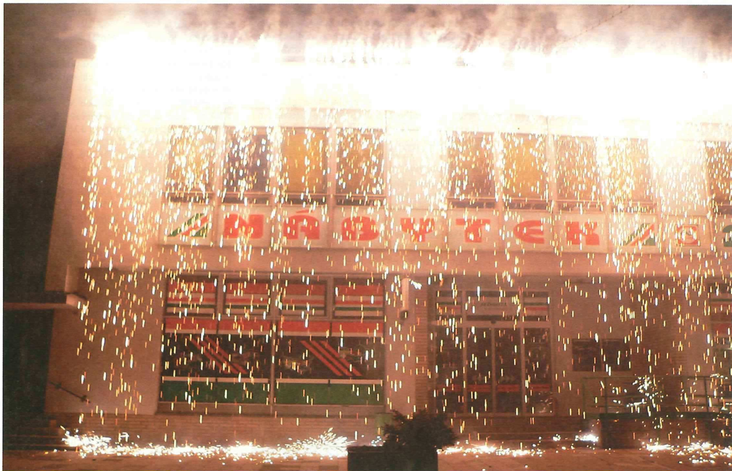
Ohnivý déšť přšel nejen v Praze na Václaváku...