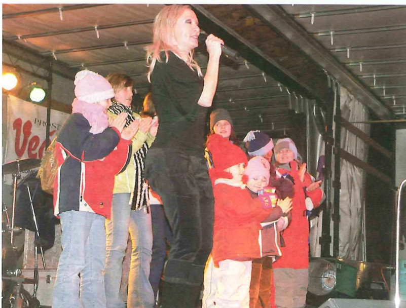
Bára Basiková na jednom z minulých ročníků

Město Konice a firma Flash in Stars v roce 1995 založili tradici vánočních trhů na konickém náměstí. Na počátku této tradice byla myšlenka udělat atraktivní kulturní program jak pro místní Koničáky, tak i pro přespolní vzdáleněji žijící lidi z širokého okolí Konice. Na prvním ročníku byla návštěvnost něco okolo 300 lidí, druhý navštívilo 500, třetí 800 lidí. Dnes už, po 14 letech, se návštěvnost pohybuje přes 7.000 lidí z Konice a okolí, Prostějova a Olomouce. Vánoční trhy v Konici jsou už natolik vyhlášené, že už patří neodmyslitelně k předvánočnímu shonu. Za celou tu dobu, co pořádáme vánoční trhy ve spolupráci s městem Konice a za velké účasti sponzorů, bez kterých by trhy nemohly vzniknout, se v Konici vystřídala velká spousta umělců, např. Bára Basiková, David Kraus, Terne Čhave, nebo v posledním ročníku Petr Spálený, Holóbkova mozekka, Kreyn a mnoho dalších. Tímto jim chceme všem poděkovat za dlouholetou spolupráci a účast na této tradici. Doufáme, že nám všichni zůstanou věrni a že nadále budou tuto akci podporovat nejenom finančně, ale i svoji účastí.