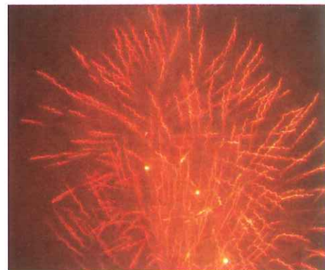
(Ohňostroj zajišťovala firma Flash in Stars)