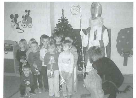
(Mikuláš navštívil Mateřskou školu v Konici)