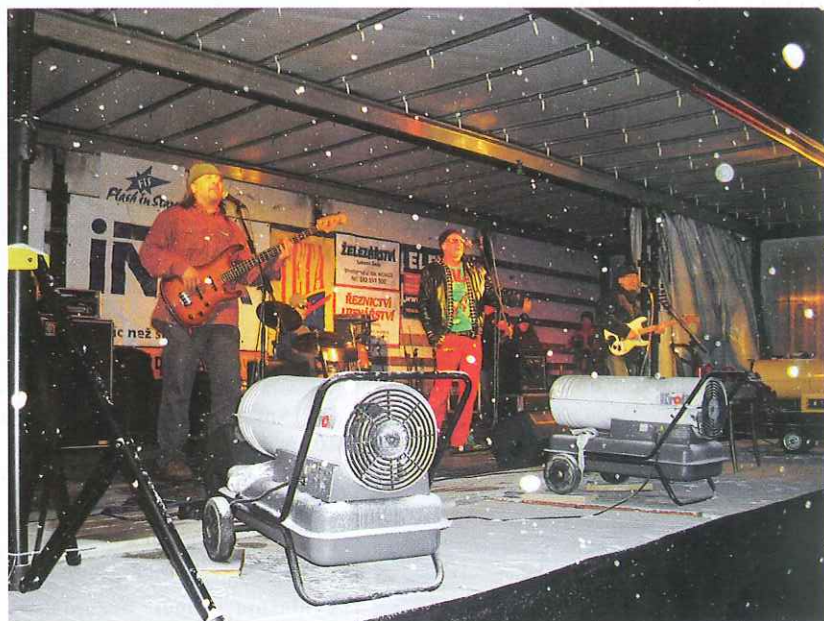
(Abraxas - rocková legenda z Prahy)