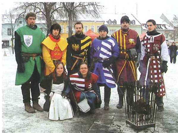
(Eques Tempus - skupina historického šermu z Ochoze)