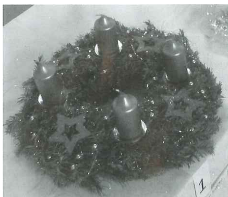
(Vítězný věnec Mateřského centra Srdíčko)