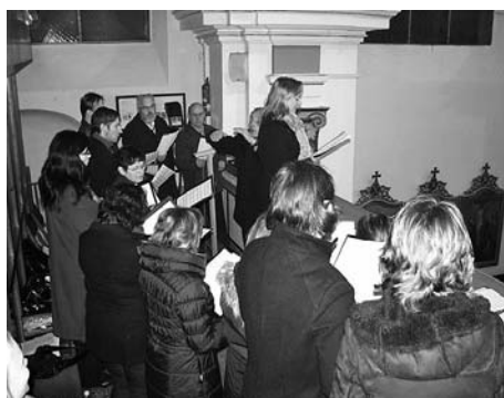
(Foto z Vánočního koncert 26.12.2012 v CHNPM Konice)

Otevírací doba TIC po dobu vedlejší turistické sezony (září - květen): pondělí - pátek 9.00 - 12.00 a 13.00 - 16.00 hod., sobota - neděle zavřeno. (Prohlídky jsou vždy v celou, nejpozději hodinu před zavírací dobou), prohlídku lze objednat také telefonicky či mailem ( 582 334 987, 739 333 721, icko.konice@seznam.cz )