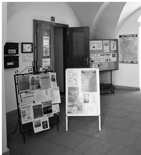
(TIC Konice - na zámku)