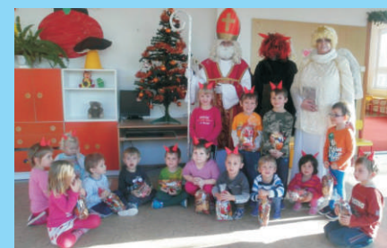
Adventní čas v MŠ Konice - str. 4