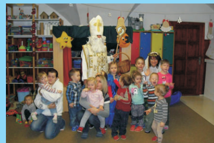
Mikulášská nadílka v MC Srdíčko 4.12. udělala radost dětem i maminkám.