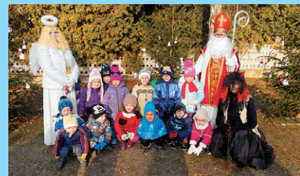
Předvánoční čas v MŠ Konice – str. 4