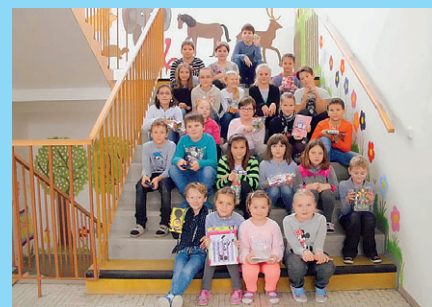
ZŠ Konice – Sběr papíru – str. 7