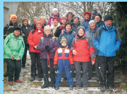
Novoroční výstup na Kosíř - str. 7