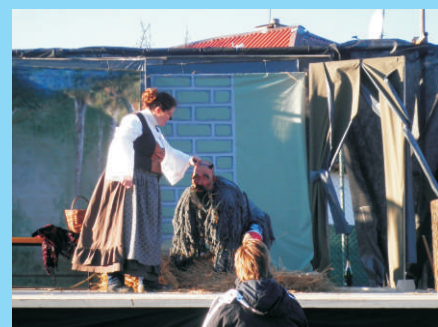
Ochotníci z Březska - str. 7