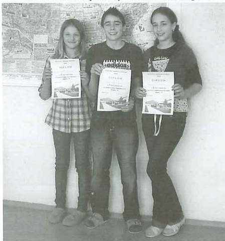
(vítězové kategorie IB)