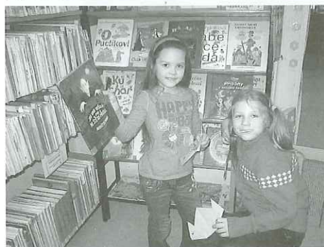
(fotografie z knihovny) (v MŠ Konice to žije)