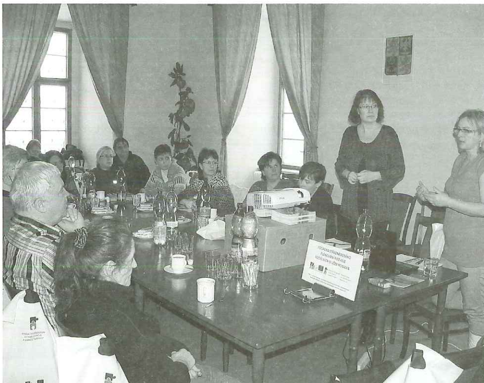
(Nový projekt má cíl zefektivnit síť sociálních služeb na Konicku. Jejich poskytovatelé se setkali na konickém zámku.)