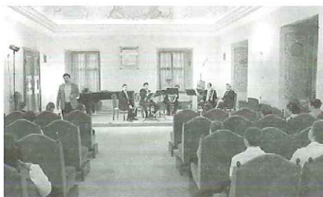
(Koncert Express Brass po soutěži)