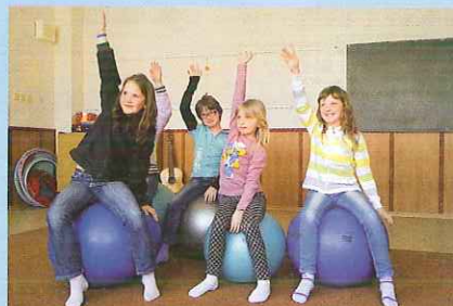
Rehabilitační pomůcky ve školní družině - str.3