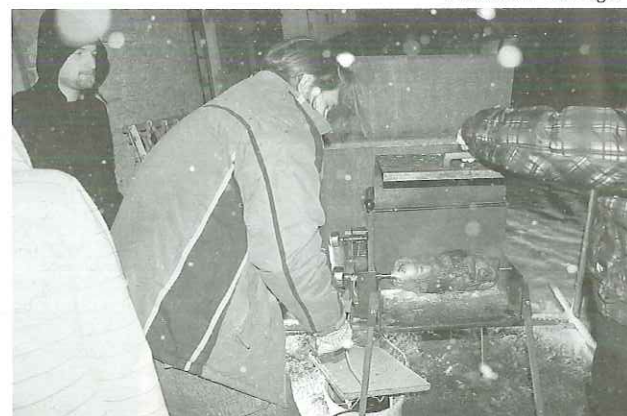
(Takhle to vypadalo na gril párty)