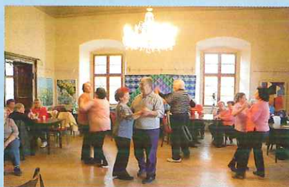
Senioři roztancovali zámek při Odpoledni s písničkou - str. 5