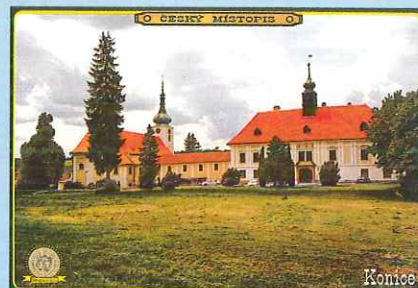
Nové pohlednice z edice Český místopis zakoupíte v TIC Konice na zámku - str. 5