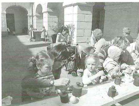
(Zajíčková dílna na zámku)