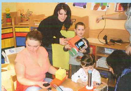
Den dopravních prostředků v MŠ Konice - str. 3