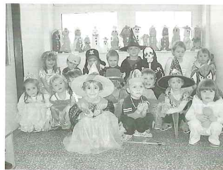
(Karneval v MŠ Konice)