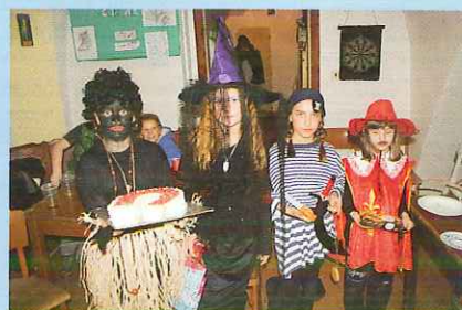
Skauti měli karneval - str. 4