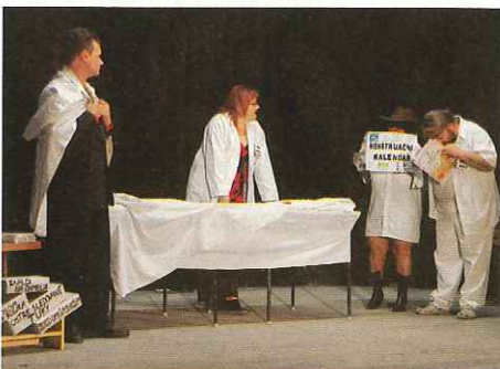
Živňácké hlahol ordinoval ve Špitále bez zahrady s nasazením, jak se na lékařské hrdiny sluší a patří. Občas to ale nevyšlo...