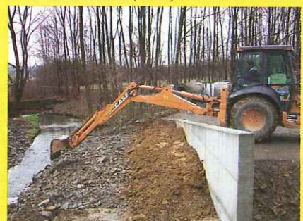
(Úprava toku Romže)