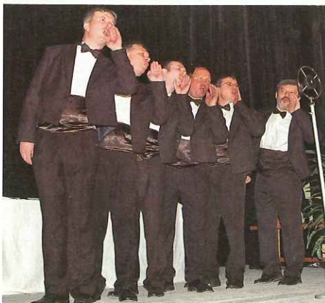
Slavíci nepřilétli z Madridu, ale ze Slatinek... Jejich minirecital byl ovšem naprosto skvělý