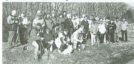
(Odběr vody z pramene Romže, kterého se zúčastnilo asi 50 turistů)

V našem blízkém okolí již proběhla tato akce pořádaná turisty z Prostějova za účasti konických turistů. Dne 22.3. byl odebrán vzorek vody z pramene Romže, která pramení v obci Dzbel.