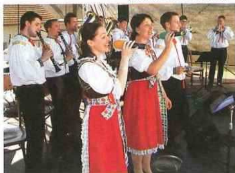
(Hanačka přivezla i krojovanou omladinu)