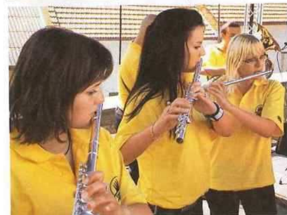
(Flétny jsou charakteristické pro Holóbkovo mozeko) (Mažoretky ZUŠ Přerov)