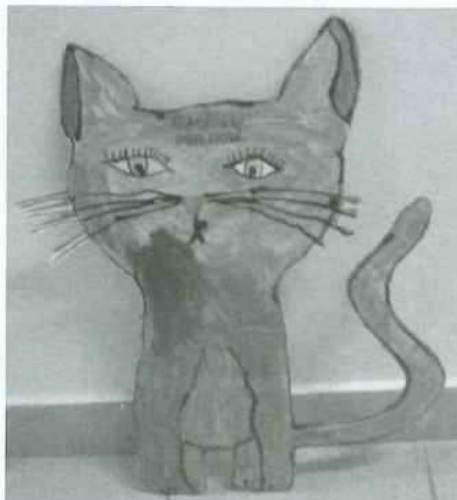
(Výtvarné počiny malých umělců můžete shlédnout na chodbách ZuŠ Konice)