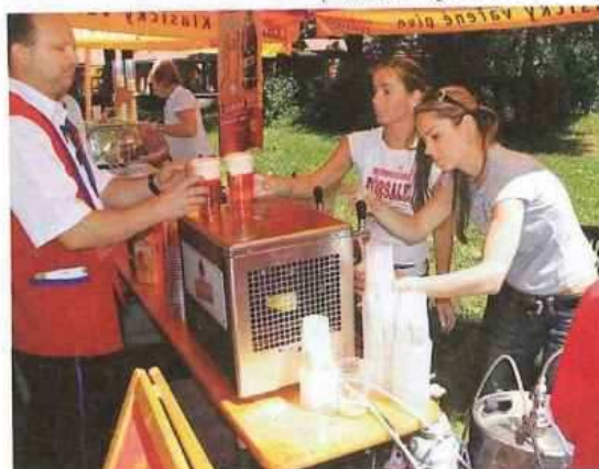
(Pivovar Litovel předvedl opět profesionální výkon)