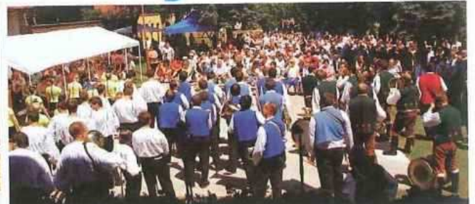
(Průvod městem a zahájení festivalu)