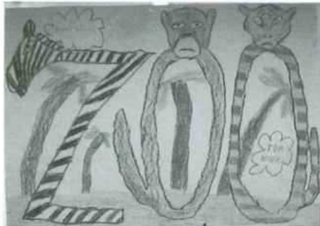
(ZOO v "Zušce")