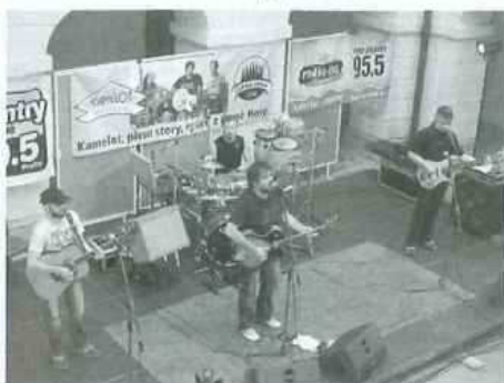
(Kamelot na nádvoří Konického zámku)

Během 110 dnů odehrál Kamelot 110 za sebou jdoucích koncertů, během kterých představil a pokřtil své nové CD Mořská sůl, které najdete na pultech od 27.2.2009. Skupina Kamelot a všichni partneri a pořadatelé budou zapsáni Agenturou Dobry den z Pelhřimova do České knihy rekordů. Konice bude mezi nimi!