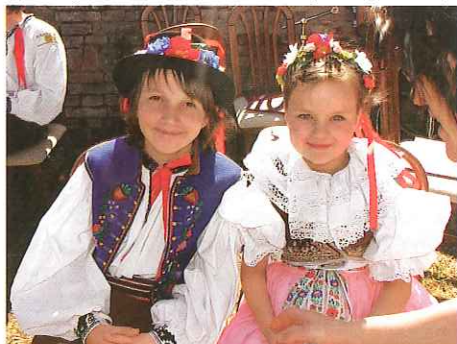
(I mláďi patří na Žváčkův festival)

Před samotným zahájením přehlídky zahraje Holóbkova mozeka. Samotnou přehlídku zahájí domácí Koničanka, dále vystoupí Malohanačka z Velkých Opatovic,