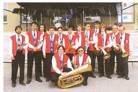
(Koničanka na festivalu v roce 1998)

O občerstvení se tradičně stará Pivovar Litovel, který pro letošní ročník připravil "Žváčkův litovelský speciál"; jedná se o dvanáctistupňové kvasnicové pivo, vyrobené zvláště pro tuto akci!