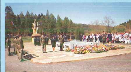
Pietní akt v Javoříčku