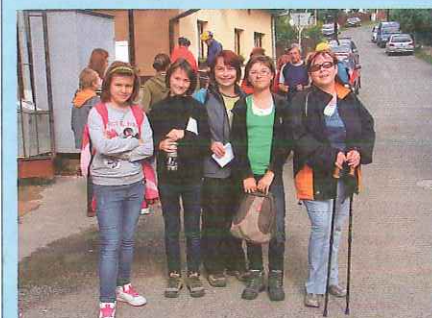
Konické štrapače a Na kole okolo Konice se opět blíží - str. 4

Dechové orchestry účastníci se projektu: Holóbkova mozeka , Malohanácká muzika , Velký dechový orchestr Konzervatoře Brno , Dechová hudba ZUŠ Zdounky , Malohanačka , Astra , Svitavská dvanáctka , nově vznikající Žváčkova muzika z Konice a Dechový orchestr při záchranném hasičském sboru Olomouckého kraje .