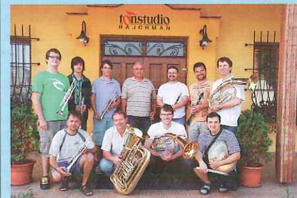
Nový dechový orchestr Žváčkova muzika z Konice nahrál významnou část skladeb na nové CD Antonína Žváčka, které bude představeno a pokřtěno na letošním Žváčkově festivalu