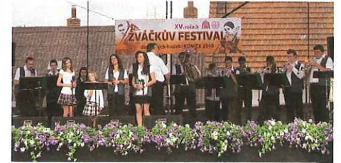
(ŽUŠ Zdounky - vítěz festivalu)

Festivalem provázal herec a moderátor Vladimír Hrabal. Velký dík patří TON studiu Rajchman z Dolních Bojanovic, které zajistilo vynikající ozvučení festivalu. Pořadatelům a návštěvníkům festivalu bohužel nepřálo počasí, naštěstí však nepršelo, a tak poněkud chladnější den přiměl k návštěvě přibližně jen 500 diváků.