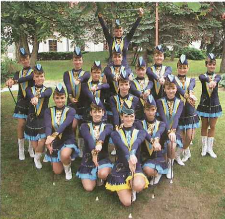
(Mažoretky GINA Přerov - mistr republiky v mažoretkovém sportu pro rok 2010)