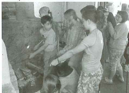
(ZUŠ se loučila se šk. rokem v areálu chovatelů)

Zcela opačného výsledku dosáhlo naše B mužstvo, když po ročním působení v 1. B třídě hned postoupili do vyšší soutěže, kterou je 1. A třída. V posledních třech zápasech nejdříve B tým zvítězil v Nezamyslicích 1:0 a o svém postupu rozhodl již v předposledním kole, kdy na domácím hřišti porazil Sokol Horní Moštěnice rovněž 1:0. Na postupu nic nezměnila ani porážka v posledním kole se svým největším soupeřem a pronásledovatelem Hanou Prostějov 1:3.