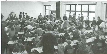
(Krajské finále - Olomouc Hejčín - Leden 2010)