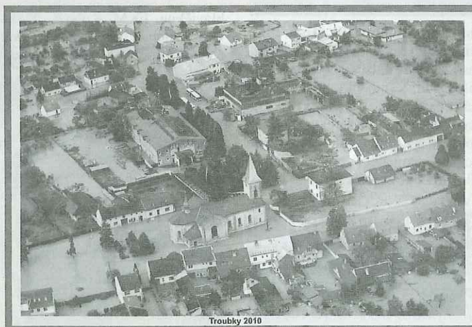
V Olomouci dne 15. 9. 2010

Jednotce sboru dobrovolných hasičů Konice za poskytnutou pomoc při odstraňování následků povodní na území Olomouckého kraje