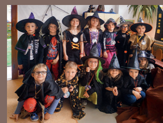
Děti se vrátily do MŠ ...str. 6