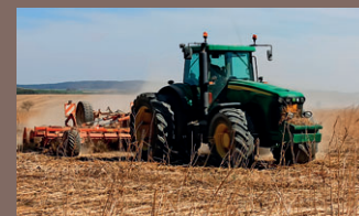
Zemědělství v Konici III. díl ...str. 6