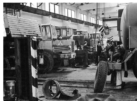
Státní statek Konice – oprava techniky

Zemědělská výroba byla započata jarními pracemi v roce 1992, a to na 1 200 ha půdy, s 850 ks skotu a 60 pracovníky. Strojový park LAKO byl tvořen 3 obilními kombajny, 2 sběracími vozy, 2 řezačkami a 11 dopravními prostředky. Byl stanoven podnikatelský záměr a ekonomická pravidla. Žádné dotace v té době nebyly, nebyl poskytnut úvěr. Ekonomické vazby a vztah ke Státnímu statku Konice se řešil ještě další rok. LAKO požadovalo farmu Konice a Runářov bez dalších subjektů. Restituční nárok nepokryl hodnotu těchto farem. Musela být uzavřena smlouva na dokup majetku statku, 7 milionů Kč jako úhrada pro Pozemkový fond se zálohovou splátkou okamžitě, a dále na splátkový režim dodatečně. Město Konice nám odprodalo dům na náměstí na vybudování vlastní prodejny. Vzhledem k tomu, že Pozemkový fond trval na zvýšení kmeno-