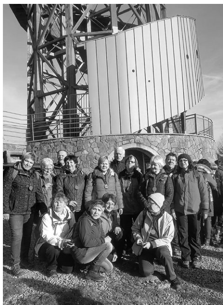
1. 1. 2023 – Tradiční výstup na Velký Kosíř