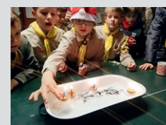
Skaut Konice ...str. 3