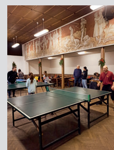
SDH Nová Dědina ...str. 3