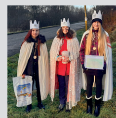
Tříkrálová sbírka ...str. 2

je český dokumentární fotograf, vysokoškolský pedagog, kurátor a organizátor kulturního života. Zaměřuje se na dokumentování života na venkově a obyvatele českých vesnic, věnoval se tématu zemědělství, potom také těžké práci v továrnách (knihy Lidé třineckých železáren, Vítkovice, Ocelový svět). V poslední době se věnuje mnoha sociálním tématům o drogově závislých, handicapovaných, nevidomých, věznicích, starých lidech, pracovnících ve zdravotnictví, cizincích, kuřácích nebo lidech bez domova. Hodně se také věnuje sakrálním tématům (cykly Brána naděje nebo Prozřetelnost boží). Vydal 37 knih, mnoho katalogů a ilustrací knih. Jeho kniha Kde domov můj získala 1. cenu v evropské soutěži a 1. cenu v soutěži Nejkrásnější kniha v roce 2017. Měl více než 1400 samostatných výstav v České republice i v zahraničí. Je zastoupen v nejvýznamnějších sbírkách v České republice i ve světě. Bylo o něm natočeno několik filmů – Jan Špáta: Mezi světlem a tmou, 2000, Aleš Koudela: Jindra ze Sovince, 2006, Libuše Rudinská: Na tělo, 2018. V roce 2019 Kamil Zajíček se Štěpánkou Bielezovou natočili film o Štreitových aktivitách v Sovinci, který získal 1. cenu v ČR a 3. cenu na světovém festivalu v Sanghaji. Za své poslání považuje Štreit svými projekty poukazovat na problémy ve společnosti, které se neřeší – nebo se řeší jen velmi pomalu.