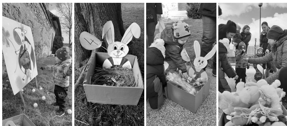
Fotoreportáž ze Zajíčkovy nadílky MC Srďčko 5. dubna 2023. Bylo chladno, ale hezky. :-)

Prohlídkové trasy zámku Konice a expozic Muzea řemesel Konicka, z. s., probíhají celoročně s průvodcem. Nabízíme prodej suvenýrů, regionálních produktů a služby TIC třídy C. Prohlídky zámku o víkendech a mimo uvedené časy vám zajistíme jen po domluvě předem, v týdnu v informačním centru, nebo se správcem zámku, tel.: 724 328 934. Více na: www.mekskonice.cz