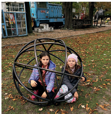
Kovozoo – pokračování ze str. 1

...ale také přímou účastí dětí na sběru použitých baterií, drobného elektrozařízení, mobilních telefonů nebo tonerů. Za tyto aktivity získává ško-