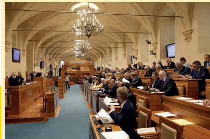
Jednací sál Senátu

Starosta města Konice oznamuje, že volby do Zastupitelstva Olomouckého kraje a volby do Senátu Parlamentu České republiky se budou konat v pátek 20. září 2024 od 14.00 do 22.00 hodin a v sobotu 21. září 2024 od 8.00 do 14.00 hodin.